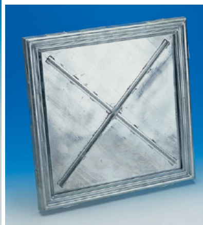
zesílená spodní strana víka